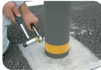
1.下部ピンを取り外し・・・

本体にはリサイクルゴムを採用。又簡単に芯材と分離することが可能で再利用や分別廃棄ができます。