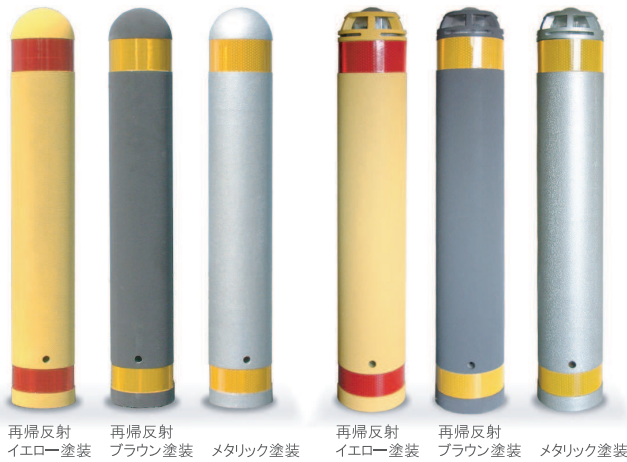
再帰反射イエロー塗装 再帰反射ブラウン塗装 メタリック塗装 再帰反射イエロー塗装 再帰反射ブラウン塗装 メタリック塗装